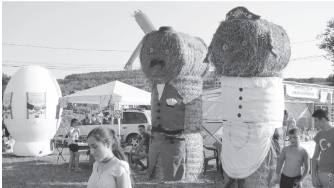
Kötetlenebbül zajlott a négy település jeddai találkozója.