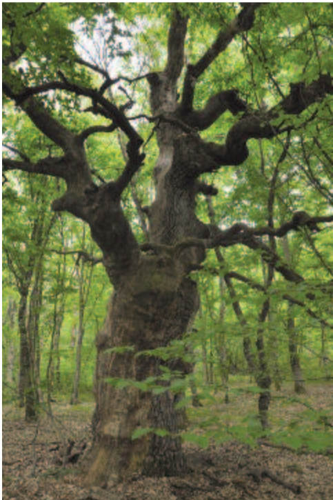
Több száz éves kocsányos tölgy a Mocsár-erdőben

A román királyi kastélytól keletre, mintegy 1 km távolságra (a hajdani pionirtábor bejáratánál) volt Horthy Miklós, Magyarország egykori kormányzójának a vadászkastélya. Horthy II. Károly magyar király bukása után, 1940 szeptemberében meg akarta vásárolni a román vadászkastélyt. Mivel nem tudtak megegyezni, 1941-ben fel-