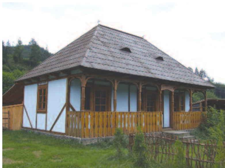
Görgény-völgyi falusi ház

épületét, erdő között halad a megyei út. Nemsokára balra egy löszerraktár látható, szemben vele jól egyengetett, téglalap alakú mező. A területet a második világháborúban a németek katonai reptérként használták. Az erdőben a szocialista időkben is használt löszerraktár bunkerei még megtalálhatók, amelyeket átvett a szászrégeni önkormányzat. A katonai objektumot elhagyva, baloldalt feltűnnek Görgényoroszfalu házai, majd elérünk a görgényszóaknai eltérőhöz. (A faluban sós fürdő van, erről egy későbbi lapszámunkban írunk.) Az