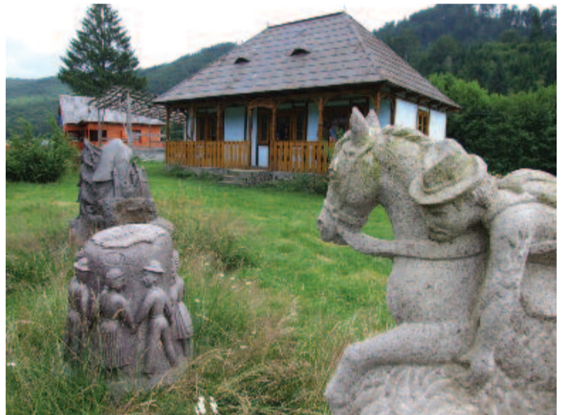
A görgényi fesztivál helyszíne

Ceaușescu házaspár egyik kedvenc kiránduló-, vadászóhelye lett, ahol a diktátor többször tartózkodott. Az 1989-es rendszerváltást követően az állam tulajdonában maradt, majd miután Paul Philippe, Románia hercege (sikertelenül) visszagyógyult, a Grand Rt. privatizálta az egységet, és ma elit vendégházként működött. A komplexum hat