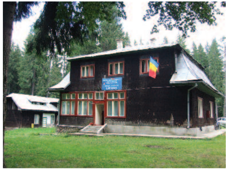
A laposnyai tábor

Görgényszentimréről indulva Erdőlibánfalván keresztül közelíthetjük meg Laposnyatelepet. A megyei út nagyon gyatra állapotban van, de a táj szépsége némileg kompenzálja az út okozta bosszúságot. Az erdésztelep a Görgényi-havasok egyik oldalgerincének – egykori vulkáni kúp kalderájának – tövében a Fehérág, Székelyó, Laposnya- és Nyak-patakok találkozásánál fe-