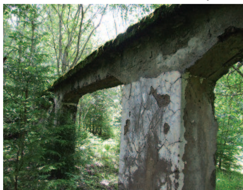
A volt Horthy-kastély fala

építette a saját, kétemeletes, az osztrák Alpok épületeire emlékeztető vadászkastélyát. A földszinten ebédlő, konyha, fürdőszoba és orvosi rendelő, az emeleten a lakosztályok és egy hatalmas társalgó volt. A szobák padlózata és a lépcső vörös sziszafagyökérből készült. A színes csempekályhák a Görgényben található összes nagyvadat és madarat ábrázolták. A lépcsőház falait üveg- és tükörborítás, az ajtókat faragott virágábrázolás díszítette. Vízét az 1 km-re levő Tolvajkút forrásából szabadeséssel vezették be. A rendszer most is működőképes. 1945-ben a kastélyból és a mellette levő személyzeti lakásokból pionirtábor alakítottak ki. 1958-ban, máig tisztázatlan okokból, a kastély leégett, később kiderült: a securitate irányította „művelet” volt. Jelenleg benőtték a bokrok, fák, cserjék, csupán néhány fal és a pincék láthatók. Az egykori pionirtábor az erdőlibánfalvi polgármesteri hivatal adminisztrálja. Néhány épületét felújították, a többi elhanyagolt állapotban van. Kibérelhetők. Innen a Bakta-tetőn keresztül elérhetünk Gyergyóremetere.